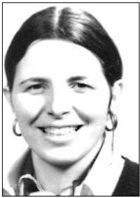
di GABRIELLA ZANUSO GALUPPO